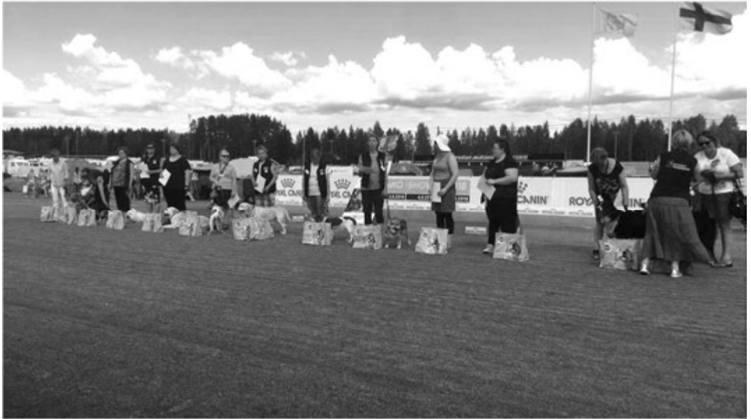
Sawo Showssa palkittiin myös Kennelliiton kaverikoiria, kuva: Sawo Show fb-sivulta.