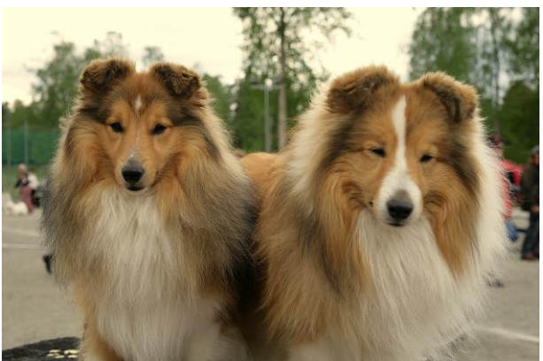
Kuvamuistot: Kolomen Kimppa, Keitele